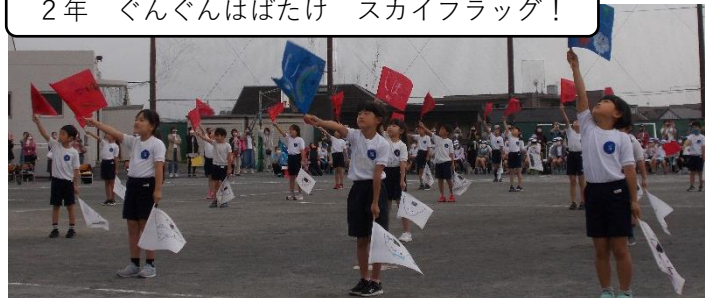
2年 ぐんぐんはばたけ スカイフラッグ！