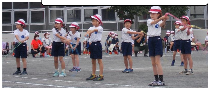
1年 どんなときも☆ぴかいち Dance