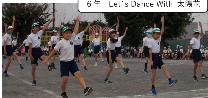
6年 Let's Dance With 太陽花