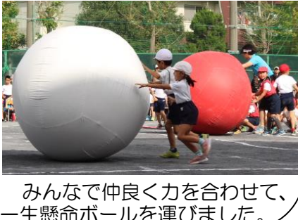
みんなで仲良く力を合わせて、一生懸命ボールを運びました。