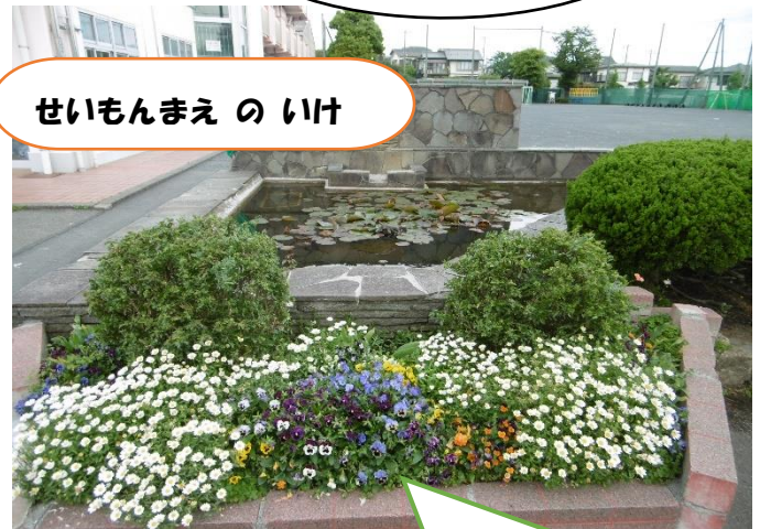
せいもんまえのいけ

ちいきのかたが さつえいしたしゃしん です。たくさんのとりがいます。どこにかざっているのでしょうか？ひんとは、「2かい」です。