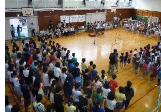
磯子区長さんも来校してくださいました。

9月26日(月)に、音楽朝会が行われました。回を重ねるたびに、来校される地域や保護者の方が増え、温かい雰囲気にも包まれた会になっています。そんな歌声が広まり、今回は歌声を杉田劇場の方に録音していただいたり、会の様子の取材が入ったりしました。みんなの声が一つになってすてきな歌声が響きました。月1回の音楽朝会にぜひ来校いただければと思います。