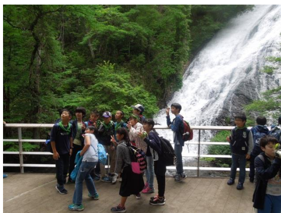
湯滝にてグループ写真撮影