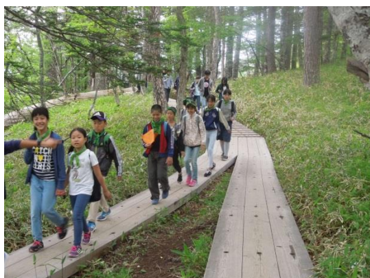
戦場ヶ原ハイキング(木道)