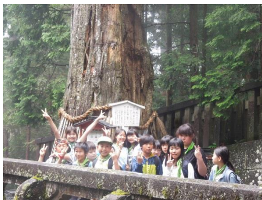
家康の墓近くの杉