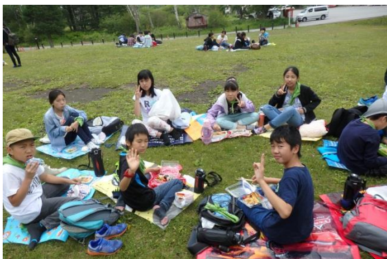
戦場ヶ原・三本松での昼食