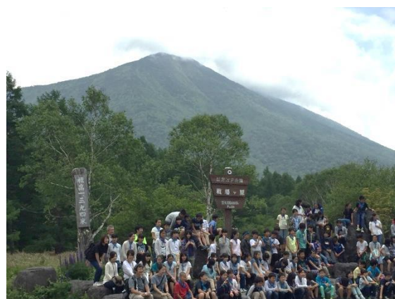
戦場ヶ原で集合写真撮影(男体山をバックに)