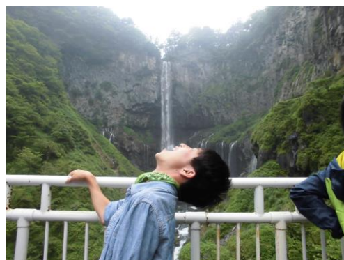
華嚴の滝の水はおいしい?