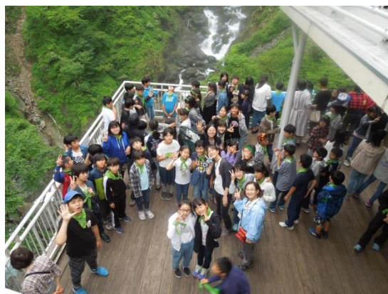
華嚴の滝・展望台