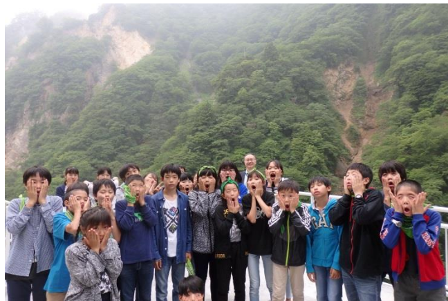
華嚴の滝にて (水量は0.3tでした。)