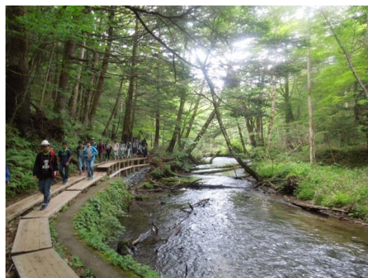
戦場ヶ原ハイキング(湯川)