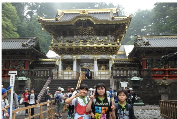
リニューアルされた陽明門