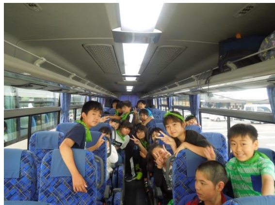
日光へ向かうバス車内(羽生PA)