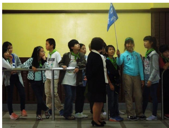
華嚴の滝エレベータ