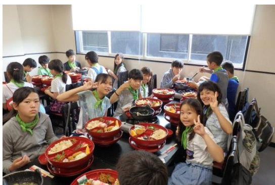
磐梯日光店での昼食