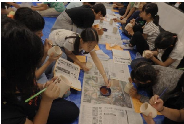
益子焼絵付け体験