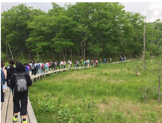
戦場ヶ原ハイキング(木道)