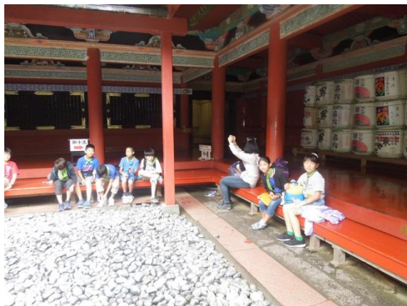
眠り猫の近くで休憩?