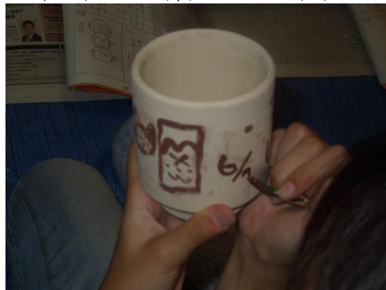
誰の作品でしょうか？