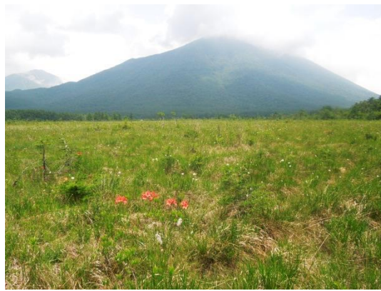
戦場ヶ原の自然 (男体山とレンゲツツジ?)