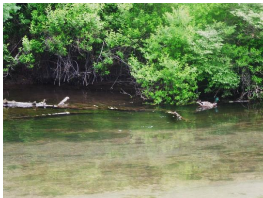
戦場ヶ原の自然 (まがも)