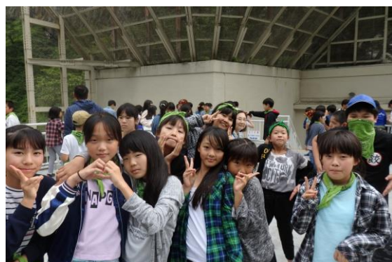
華嚴の滝・展望台