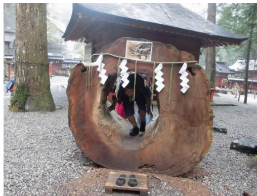
二荒山神社 (化灯笼近く)