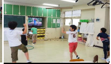
ゲーム音楽に合わせてダンス!