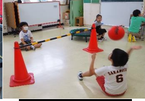
シッティングバレー