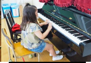
ピアノを弾いています