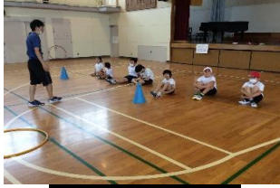
体育館でなわとび

【雨の日の過ごし方】雨の日が続き、おもしろい遊びができません。みんな「少しでも楽しく過ごそう!」と工夫しています。