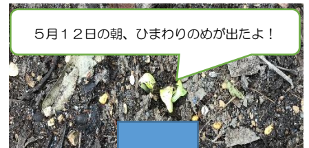
5月12日の朝、ひまわりのめが出たよ！