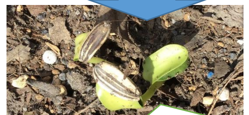
5月12日の昼には、もうこんなに大きくなってたよ・・・。生長するのがとても早くてビックリ(´Д`)