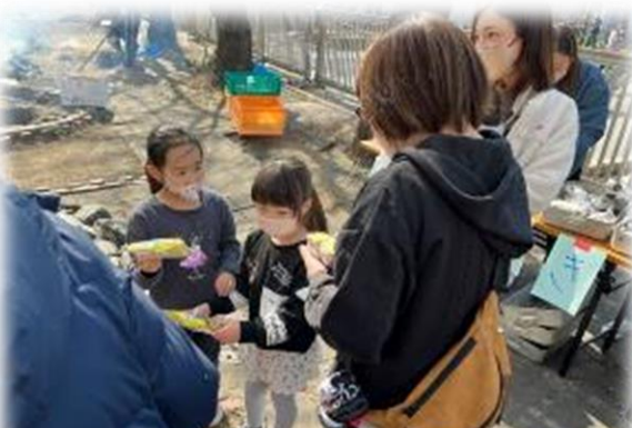
焼きたてのおいも、熱くておいしいね