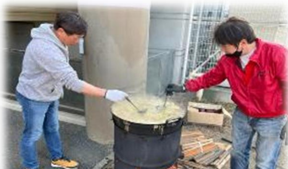
キッズと一緒に美味しい豚汁を作ってくださったおやじの会の皆さん