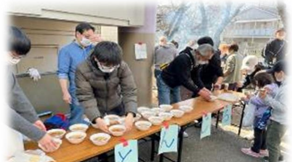
手際よく豚汁を配る PPT の皆さん