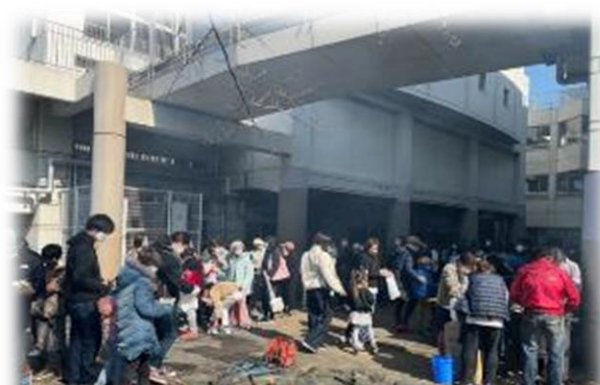
焼きいもや豚汁を配っています