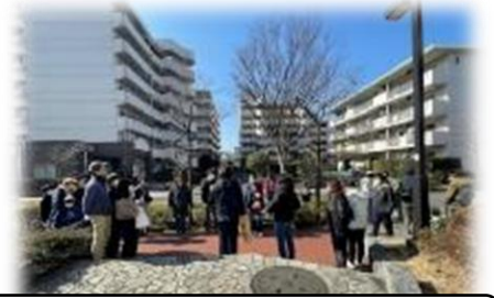
公園に集まって出発します

2月18日(土)お天気にも恵まれ、PTA 主催行事の地域清掃「ありがとう西寺尾」が行われました。コロナ禍により3年ぶりの実施となりましたが、当日は早朝からPTA 本部の皆さんや地域、キッズクラブのスタッフの皆さんがいろいろな準備に奔走してくださいました。学区内の5つの公園に集まり、子どもも大人もごみ拾いをしながら学校を目指します。ゴールの学校では焼きいもやお菓子、キッズクラブや地域の皆さんが用意してくださった豚汁をいただいて温まりました。参加人数は延べ230名を超え、子どもも大人も笑顔いっぱいの大盛況のイベントとなりました。