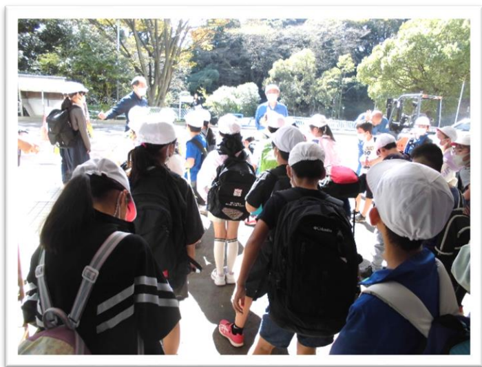
<工場の係の方にご挨拶>

実行委員（社会科見学）の皆さん、とても上手に司会や挨拶ができました。お疲れ様でした。