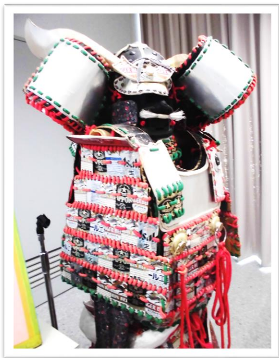
<アルミ缶のリサイクルで作った兜>