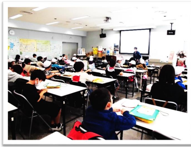
<DVD 視聴と係の方のお話>