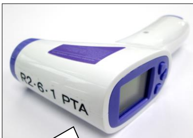
PTAより購入していただいた 非接触型体温計