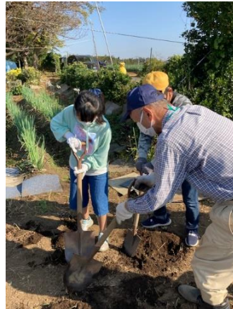
「西が岡夢プロジェクト」