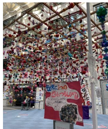
「世界に一つの西小つるしびな」

今年度は、地域の方々と交流を持つことが難しい中、総合的な学習の時間で、5年生はつるしびなや折り紙を地域の方に教えていただきながら、クラスで協力し作品を作りました。つるしびなは、2月泉区役所での「泉つるし飾り展」に展示され、たくさんの方に見ていただきました。また6年生は、中川地区社会福祉協議会が実施する里山夢プロジェクトに参加し、畑作業や収穫を体験しました。畑作りを通じて地域の方と関わる中で、自分たちが地域のためにできることを考え、学びを深めることができました。里山夢プロジェクト、西が岡クラブ、あいあい領家の皆様、ご協力ありがとうございました。