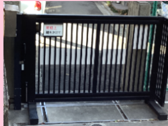
むかしのひがしもん