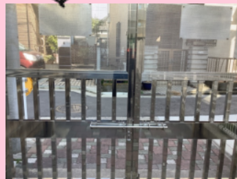
いまのひがしもん