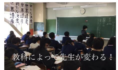
教科によって先生が変わる!