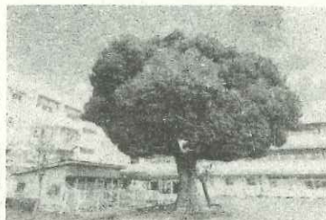
中和田小学校のシンボル「くすのき」