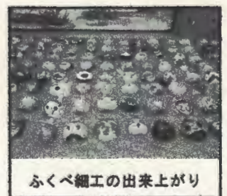
ふくべ細工の出来上がり

また、須賀神社祭礼に伴う夕刻の「愛のパトロール」では、PTA校外委員会が子どもたちの見回りを行いました。私は夜に参加しましたが物凄い人出に圧倒されました。「こんばんは」と大勢の子どもたちに声をかけられ、うれしく思いました。地域の中で見守られ育てられていることが実感できました。