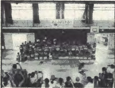
親子工作教室、修了証記念写真

いろいろな体験を通して一回りも二回りも成長した子どもたちに前期の後半が始まります。厳しい残暑が続きますが、熱中症事故防止に十分留意して取り組んでいきます。