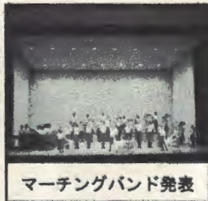
マーチングバンド発表

18日(土)は、泉公会堂で中和田中・学家地連主催第29回サマーチャリティーコンサートが盛大に開催され、マーチングバンドが熱演しました。会場からの大きな声援に子どもたちも満足した表情でいっぱいでした。社会福祉慈善演奏会として地域の協力を得て継続しています。本当に素晴らしい取組だと言えます。