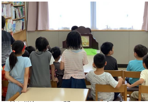
図書委員による梅雨シーズン読み聞かせ

図書委員会活動 図書館で読み聞かせ 雨が多い六月。図書委員会が読み聞かせをしました。紙芝居や大型絵本、ペープサートを楽しみました。図書委員から「また、やりたい!」という声があり、秋にもやる予定です。