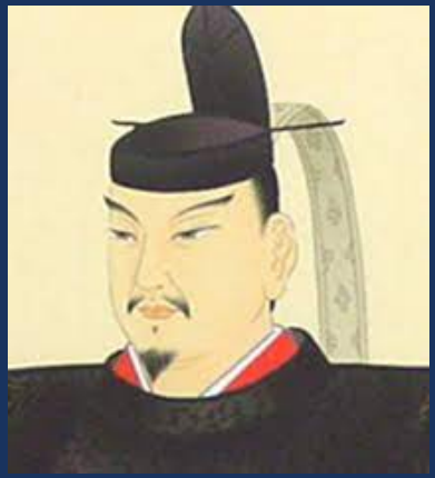
すがわらのみちざね 菅原道真