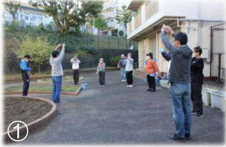
①体育館工事の関係で、集合場所は校舎裏のスマイルファームになりました。久々のドリーム体操です♪