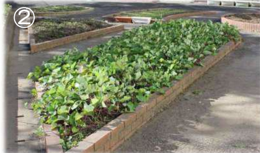
②③陽当たりの良い畑で立派に育ったサツマイモ。ツルはリース作りに利用できるの、とっておく事にしました。ツルを刈ったら芋掘り開始!! 丸々と大きく育ったサツマイモが沢山掘れました(*^^*)