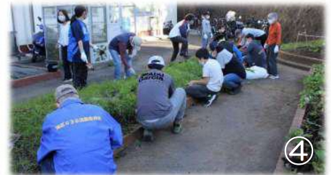
④子どもたちがワイワイと芋掘りを楽しんでいる間、地域の皆さまには、一番大変な開墾作業をしていただきました。雑草の根が深く、いつも大変です。ありがとうございます(´_`)>> ⑧この後、雑草防止のビニールシートを敷きました。学年で使用する花壇になるそうです(^_^)