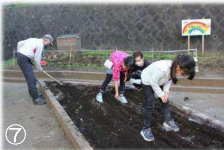
⑦収穫後はサツマイモの根っこや雑草を取り除き、畑を整えて畝(うね)作り。ここにはチンゲン菜の種を蒔きました。