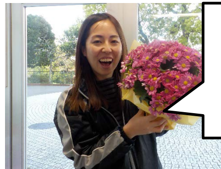
ふじえ なみか 藤恵 渚美翔 『ピタゴラススイッチ』