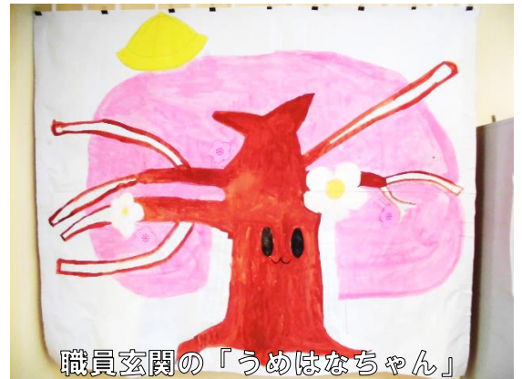
職員玄関の「うめはなちゃん」

どのように育てるかということ、各クラスでスローガンにマッチした短期目標を決めて、それをクリアしたら所定の用紙を使って、花びらや枝を増やしていくというものです。花びらは、あいさつの取り組みです。「場所に合った」「自分から」「目を見て」「いつでもどこでもだれにでも」「笑顔」という5つのポイントを意識したあいさつができれば、花びらの用紙がもらえます。それを着色して職員玄関に掲示してある「うめはなちゃん」に貼り付けていきます。木の枝は、5つの「き」の取り組みです。「勇気」「陽気」「歓喜」「規則正しい」「気づかい」このキーワードにつながる行動が見られたときに、枝の白い部分を着色して伸ばしていきます。それぞれの「き」の下にさらに目標につながる行動例が掲げられていますが、どんな具体的行動がキーワードにつながるのかという判定は、自分たちで行います。システムが少し複雑な気もしますが、各クラスの実態に合わせて目標設定をして、積極的に取り組んでいきたいと思えます。