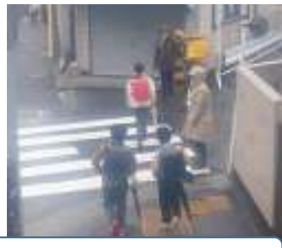
朝から冷たい雨が降っています。レインコートを着ての登校見守り有難うございます。