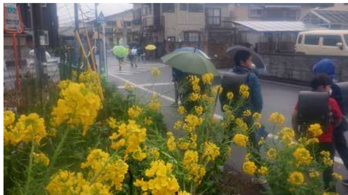
下校時には冷たい雨が降ってきました。少し早い菜種梅雨（なたねづゆ）のような毎日です。