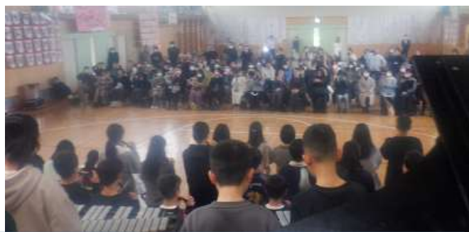
6年生 卒業を祝う会「はばたきの会」がありました。温かく感動的な会になりました。