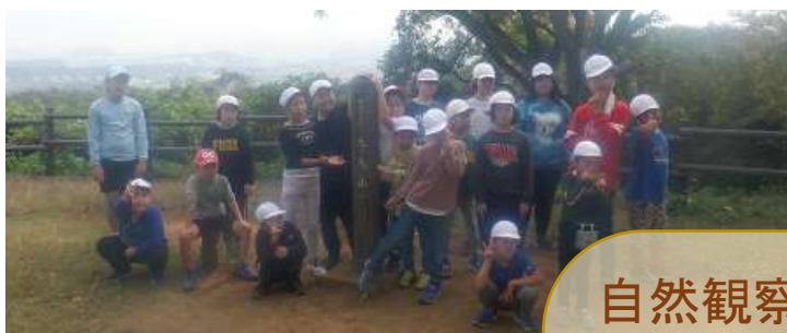
自然観察の森 ポイントラリー

金沢自然公園からみんなで助け合って山を登り、横浜の最高峰「大丸山」の山頂に到着しました。