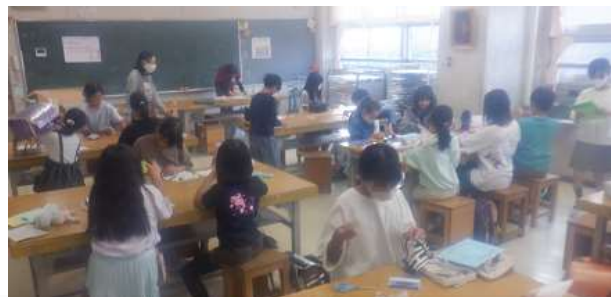
6 時間目はクラブ活動でした。 どのクラブもみんな楽しそうに活動していました。