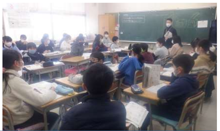
5年生 家庭科ではみそ汁の調理実習を 特活では地震からの身の守り方の学習をしました。