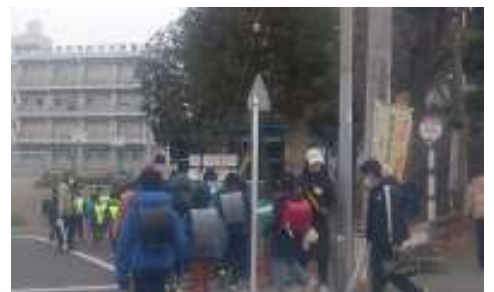
小雪の舞う寒い朝になりました。いつもの場所での登校見守り、有難うございます。