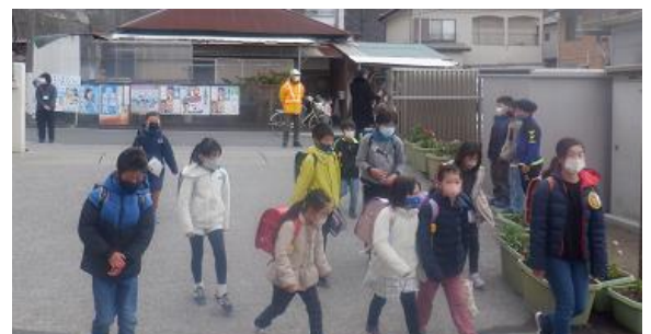
金曜日の朝、多くの地域の方々に見守られ安全に登校できています。毎週有難うございます。