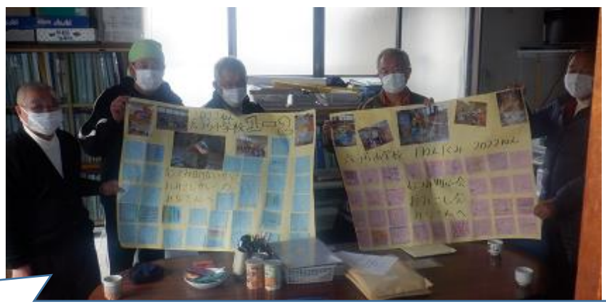
12月みこし見学でお世話になった睦町内会の神輿の会、町内会の皆さんに1年生が感謝のメッセージを届けました。