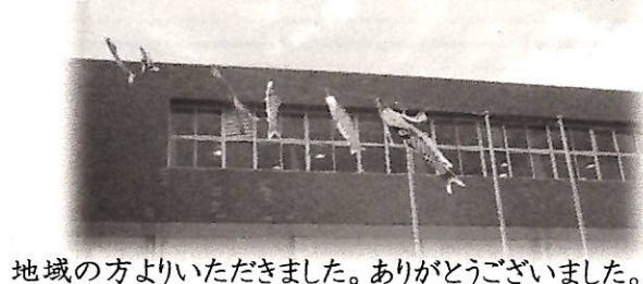
地域の方よりいただきました。ありがとうございました。

先月、「学校だより5月号の行事変更」の欄に、11月 12日(土)地域総合防災訓練中止とありましたが、 これは授業日として実施しないということで、地域の 訓練は行います。ご家庭ではお子様と積極的な地域 行事への参加をお願いします。