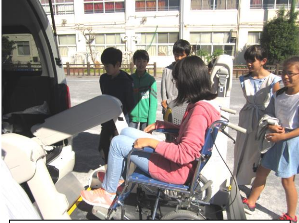
6年生・・・福祉車両や車いすの体験

人権について学び、お互いに認め合う気持ちをもてるよう、学年の発達段階に応じて、道徳の授業を行ったり、講話を聴いたり、福祉体験活動を行ったりしました。各学年の代表が1名ずつ、12月の人権集会で感想を発表し、活動について皆で共有します。