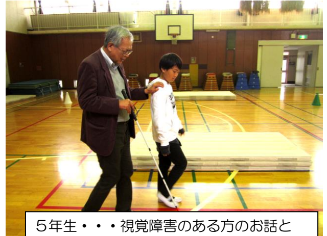
5年生・・・視覚障害のある方のお話と