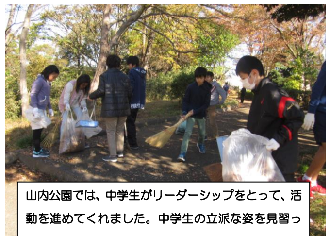
山内公園では、中学生がリーダーシップをとって、活動を進めてくれました。中学生の立派な姿を見習って、5、6年生も頑張りました。

よく使う公園なのに、今まで、ごみのことなどほとんど考えていませんでした。これからは、自主的にごみ拾いができたいと思います。中学生がリードしてくれてやりやすかったです。