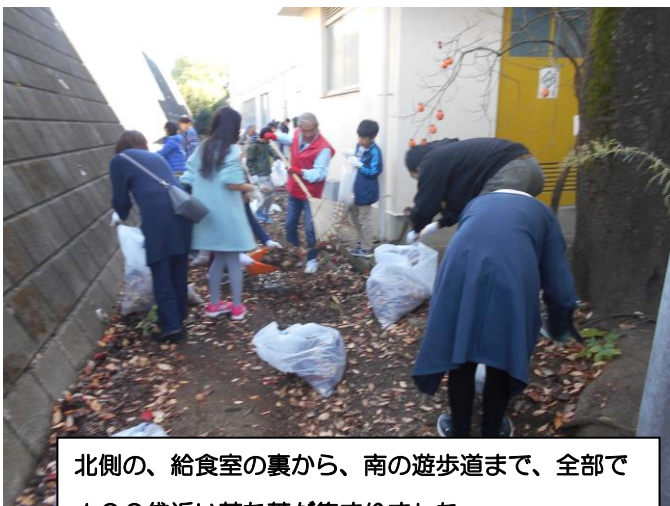
北側の、給食室の裏から、南の遊歩道まで、全部で100袋近い落ち葉が集まりました。

ふれあい清掃には、全校で200名近くの保護者の方が一緒に参加してくださり、大勢の力で、普段使っている校庭や公園、道路を短時間ですっきり、きれいにすることができました。たくさんのご協力、本当にありがとうございました。