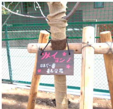
ソメイヨシノ 「日本で一番有名な花」

子どもたちの学校を大切に思う気持ちに支えられ、師岡小にお花が増えています。花いっぱいの学校になる日も近いかもしれません。