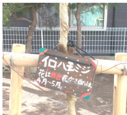
イロハモミジ 「花は赤色 花がさくのは4月～5月」