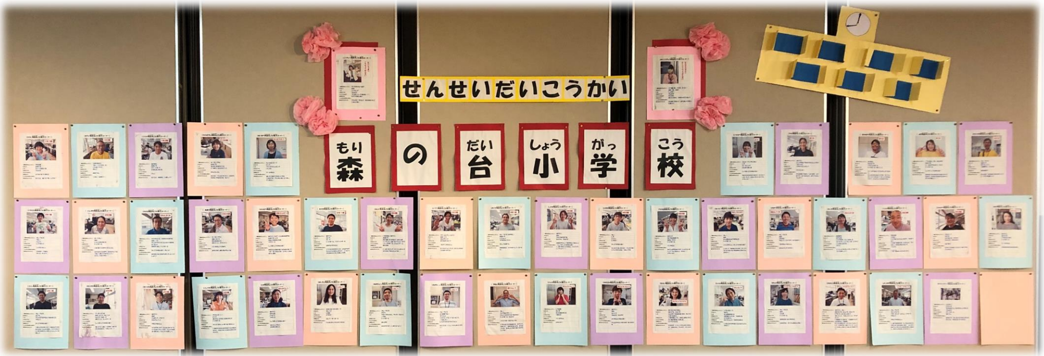
手洗い場やトイレにある足形にそって、間をあけてならんでいます。 昇降口が密にならないように、ホールで上履きに履きかえています。 ホールの掲示物です。