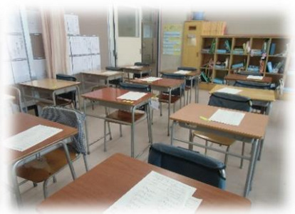
こまめな手洗いを指導しています。 放課後の消毒の様子です。 手すりなども毎日消毒します。 下校後の消毒作業や、登校前の配布物の準備をしている様子です。