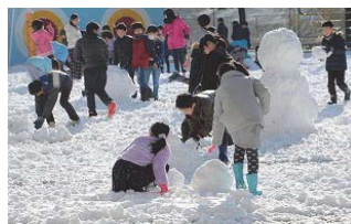
<雪と遊ぶ子どもたち>

そして、1・2時間目、安全上の注意をする担任の指導の下、楽しそうに雪と遊ぶ子どもたちを見ながら、下校時の注意事項などを考えていました。