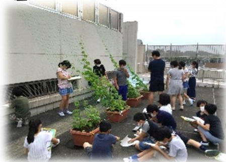
屋上のツルレイシ