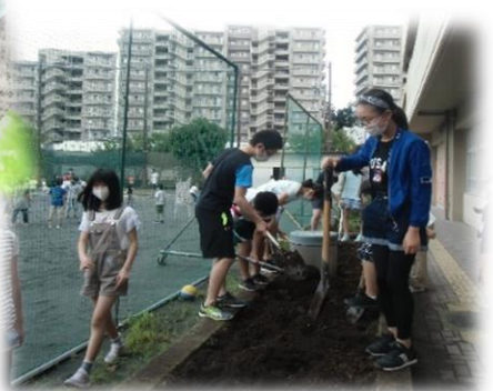
栽培委員会の活動