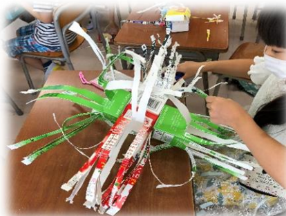
切って、ひねって、つなげると