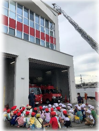
まちたんけん～緑消防署～