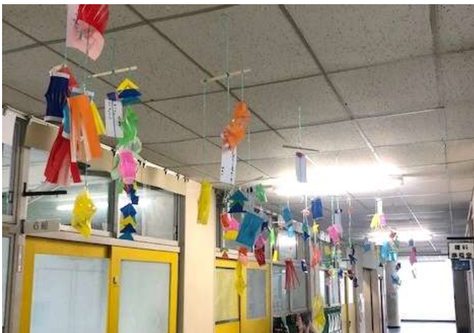
天井からつるすのは大変でした