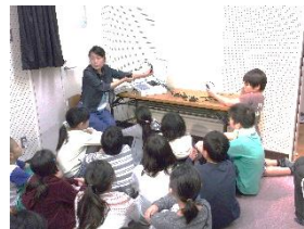
春は健康診断の時期で す。(写真は聴力検査)