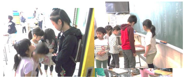
6年生が朝の支度を 手伝っています。 通称「おは1」