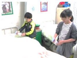
中休みに保健委員の 児童が活動していま す。