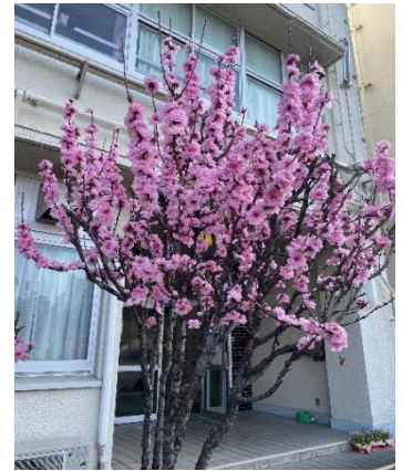
職員玄関のハナモモ

桜の花が一気に咲き始めました。学校のハナモモも満開です。今日から新年度がスタートしました。令和6年度、新1年生102名を迎え、全校児童579名が本校で学校生活を過ごします。これから一年間ともにする新しい担任と新しいクラスの仲間たちと出会い、夢と希望を抱いていることでしょう。安心して学校生活を送り、仲間と共に勉学に励み心も体も元気に笑顔いっぱいにご過ごせるよう見守っていきます。