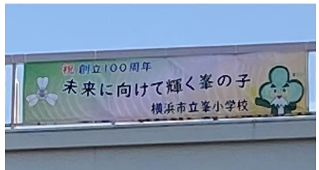
校舎の上に設置した横断幕

いかれるよう、子どもたちの良き伴走者となって教育活動を進めてまいります。子どもたちが生き生きと輝く学校づくりをめざしてまいります。