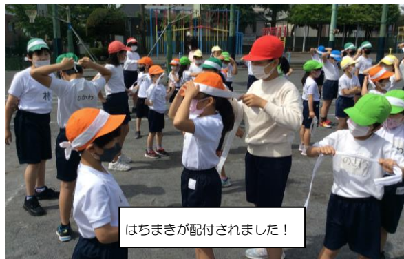
はちまきが配付されました！