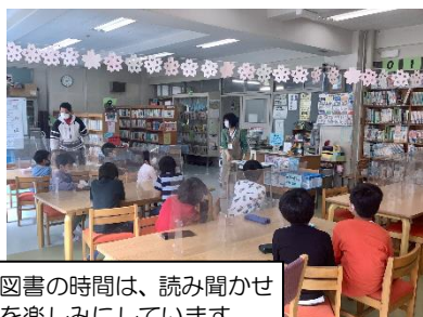
図書の時間は、読み聞かせ を楽しみにしています。