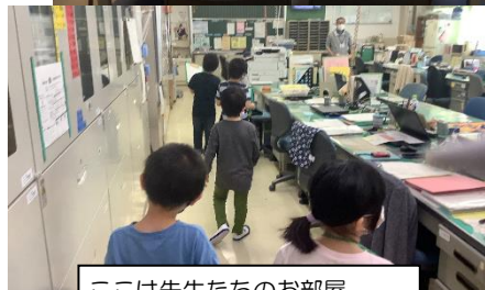
ここは先生たちのお部屋。 お仕事しているから静かにね。