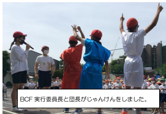
BCF 実行委員長と団長がじゃんけんをしました。