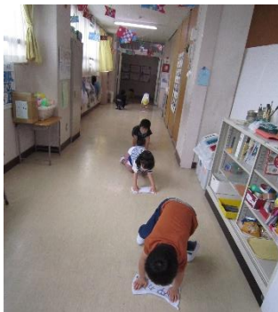
みんな雑巾がけが上手です。 手足の力が強くなります。