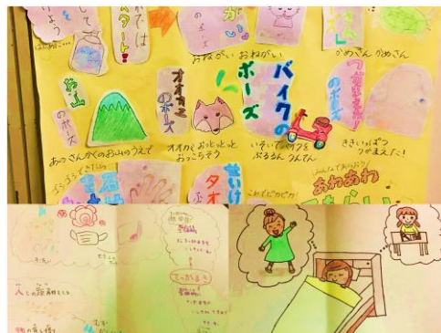
【全校に向けて発信！】

今年度の保健委員会のテーマは「みんなでつくろう！健康な体」です。新型コロナウイルス感染症の流行から2年が経ちます。感染症対策を再度見直し、意識を高めるために活動してきました。2回の「てっかまき週間」では、より意識して取り組んでもらえるように全校放送で呼びかけました。峯小の現状から保健委員で振り返り、工夫しながら実施することができました。3月の朝の時間に今年度の取り組みのまとめを全校放送で発表する予定です。今年に入ってからはオミクロン株が流行し、まだまだ思い通りにいかない生活が続きます。このような状況の中でも、体も心も元気に過ごせるよう、次年度以降も取り組んでいきます。