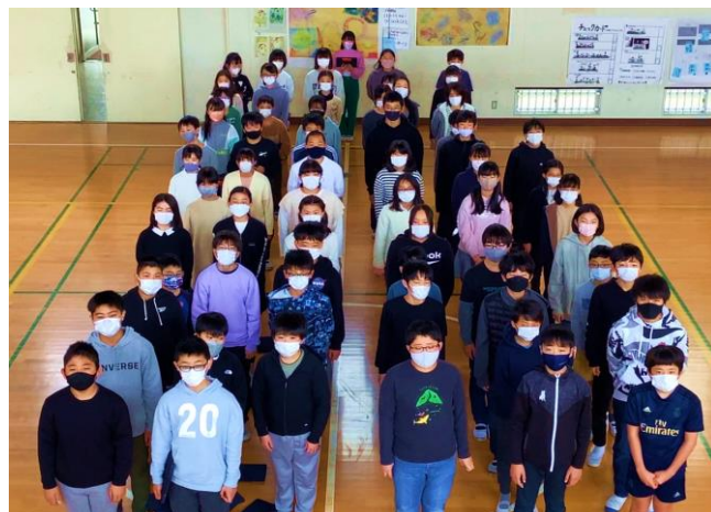
【心も体も成長しました！】

最後の行事は卒業式。残りわずかとなった学校生活ですが最上級生としての自覚をもち、胸を張って卒業してほしいです。