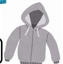
パーカー (体育のときは×)