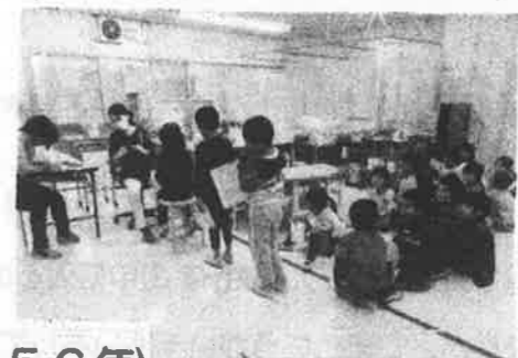
けっか 歯みがきチェックの結果(2356年)