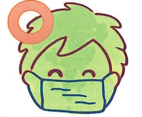
正しくマスクをつけます