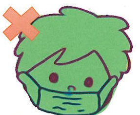
鼻を出してつけません