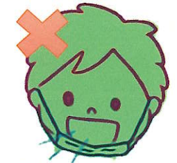
アゴにつけません

学校では、基本的にマスクを着用することになっていますが、みなさん正しくマスクをつけていますか？ 正しくマスクをつけるよう日頃から心がけましょう。