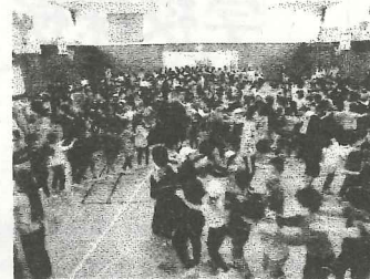
一年生を迎える会 <自慢のかわいい1年生が仲間入り>