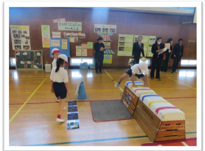
【保健部会】 3年生「毎日の生活と健康」