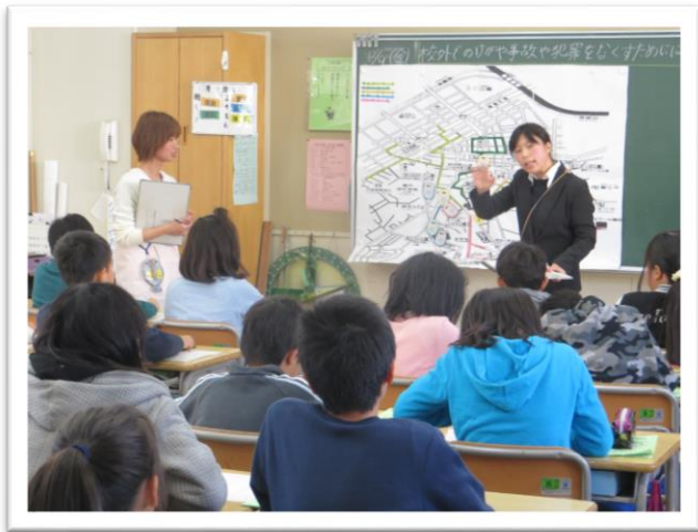
【保健部会】 5年生「けがの防止」