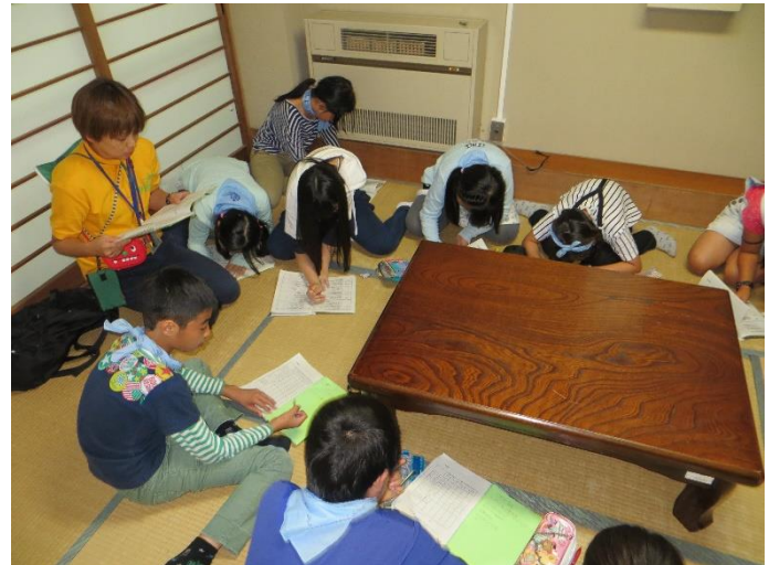
到着後、リーダー会議