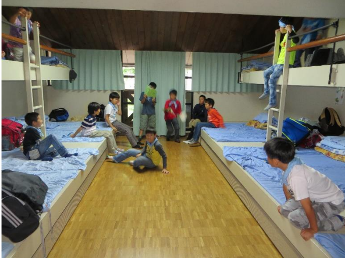
部屋はこんな感じです