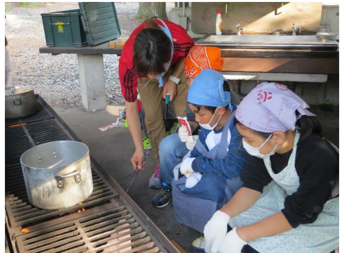
野外炊事。苦勞したけどおいしいカレーができました。