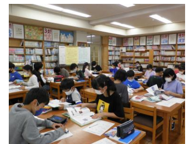
☆6年生「ポプラディア百科事典の 調べ方」みんな一生懸命に事典を 使って、ことばを調べていました。