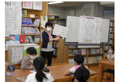
☆2年生「としよかんたんけん」 本のさがしかたの様子