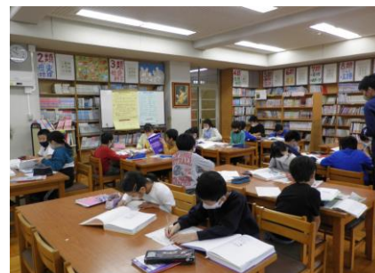
4年生 ☆調べ学習のようす

これを機会にわからないことがあったら、図鑑や事典を使って調べてくれたらうれしいです。