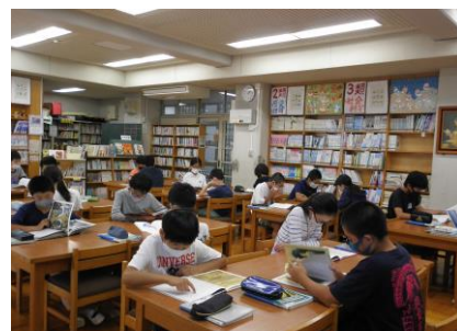
6年生・ブクトーク後「宮沢賢治」の作品の並行読書を行いました。