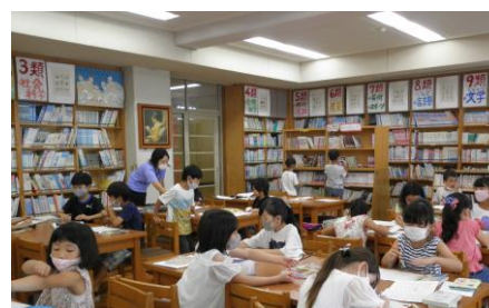
2年生紹介カードをかいている様子