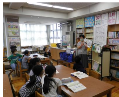
4年生「ノンフィクションの本」の授業の様子