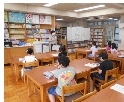
3年生国語☆図書館たんていだん