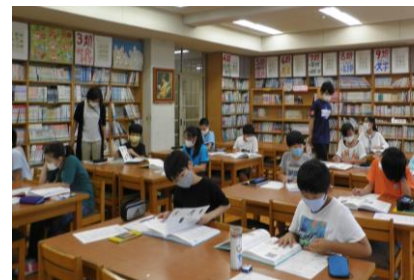
6年生☆百科事典を使って、ことばをさがして調べているようす。