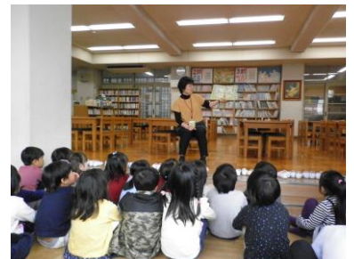
1年生・えほんのよみきかせ を聞いているようです。

て あ ことし ほん よ おも 手が上がりました。今年もいろいろな本を読んでほしいと思っています。