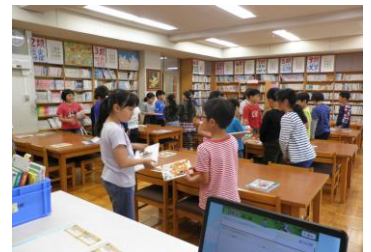
本の場所をしょうかいしあう 「本やさんとお客さんゲーム」