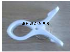
物干し竿用せんたくばさみ