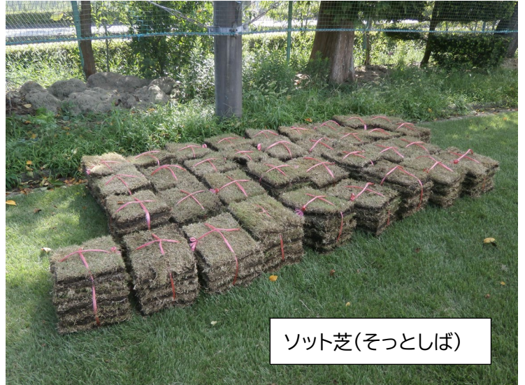
ソット芝(そつとしば)