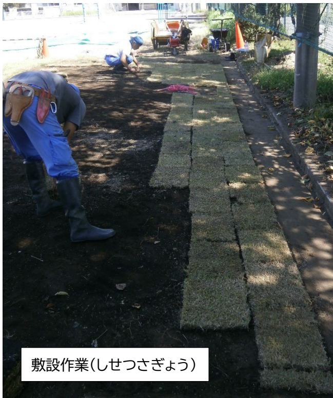
敷設作業(しせつさぎょう)