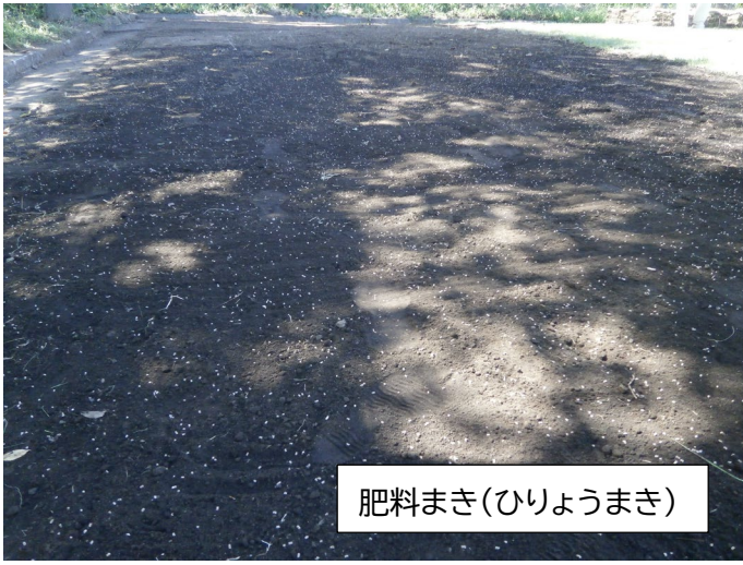
肥料まき(ひりょうまき)