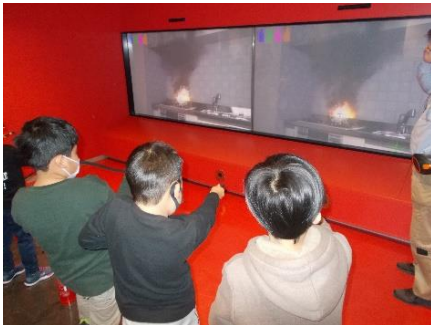
燃えているものの表面をめがけて放水！

横浜市民防災センターへ社会科学見学に行きました。消火器体験や新聞紙を使ったのスリッパ作りなど、防災意識が高まる活動をたくさん行いました。「自然災害は減らせないが、被害は減らせる。」と教わり、災害時にどのように行動するかを考えるよい機会となりました。