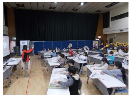
新聞紙は保温性が高いと知りました。

横浜市民防災センターへ社会科学見学に行きました。消火器体験や新聞紙を使ったのスリッパ作りなど、防災意識が高まる活動をたくさん行いました。「自然災害は減らせないが、被害は減らせる。」と教わり、災害時にどのように行動するかを考えるよい機会となりました。